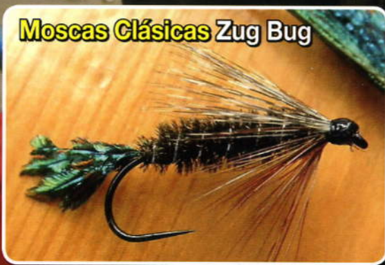
Moscas Clásicas Zug Bug