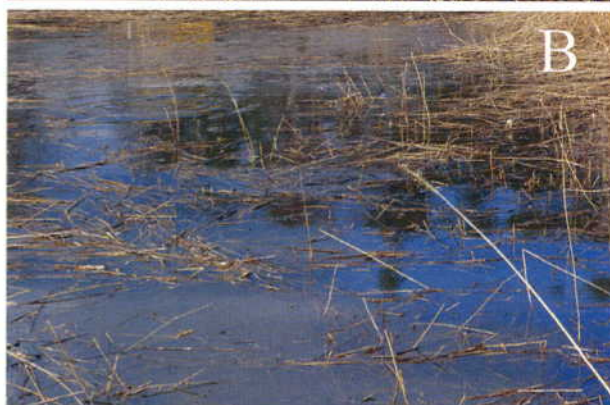
(A) Típico lugar de reproducción poco profundo situado en la orilla; el agua más turbia a la derecha es el resultado de los movimientos de los reproductores. (B) Enfocando una zona más restringida de la orilla en A, se puede apreciar tanto el barro del fondo cuanto el círculo que rompe la superficie originados por los lucios.

mosca, tanto de superficie como hundida. En estos sitios, en época de post-freza, se pueden encontrar muchos lucios escondidos justo dentro de las manchas de estas cañas jóvenes, que son aún pescables porque nuestro artificial se puede todavía mover en el interior de estas manchas de vegetación. Allí, y con una alta probabilidad, se pueden encontrar al acecho varios lucios de dimensiones muy interesantes, que serán totalmente inalcanzables más tarde cuando, con el paso de algunas pocas semanas o meses, estas manchas de cañas se cerrarán completamente y nos impedirán pescar en su interior