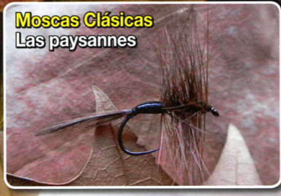
Moscas Clásicas Las paysannes