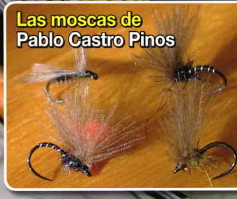
Las moscas de Pablo Castro Pinos