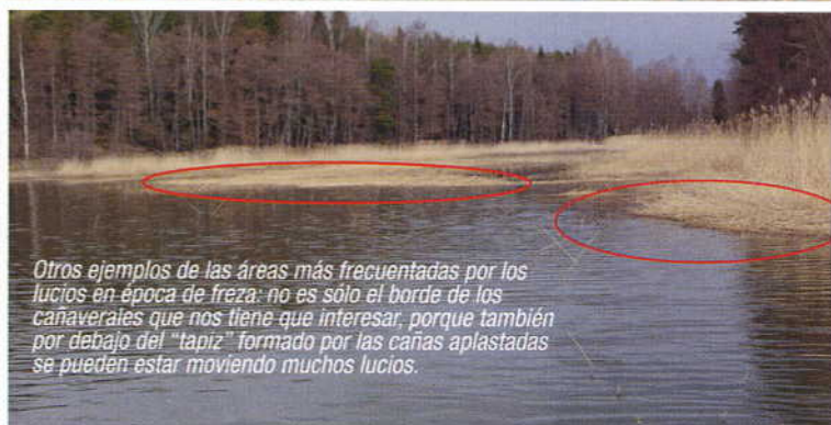
Otros ejemplos de las áreas más frecuentadas por los lucios en época de freza: no es sólo el borde de los cañaverales que nos tiene que interesar, porque también por debajo del "tapiz" formado por las cañas aplastadas se pueden estar moviendo muchos lucios.